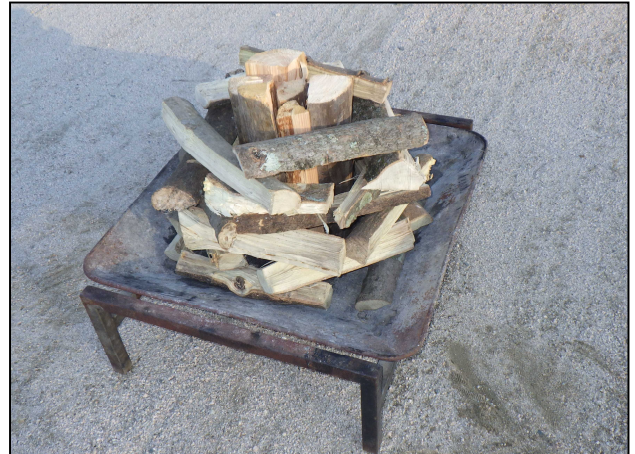
4. 細い薪を束の周りに入れていく