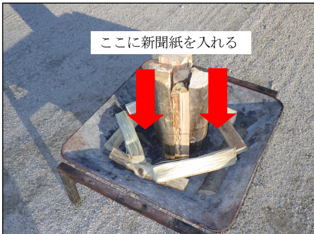
3. 束と同じくらいの高さまで組んだら束の周りに新聞紙をねじって入れる。