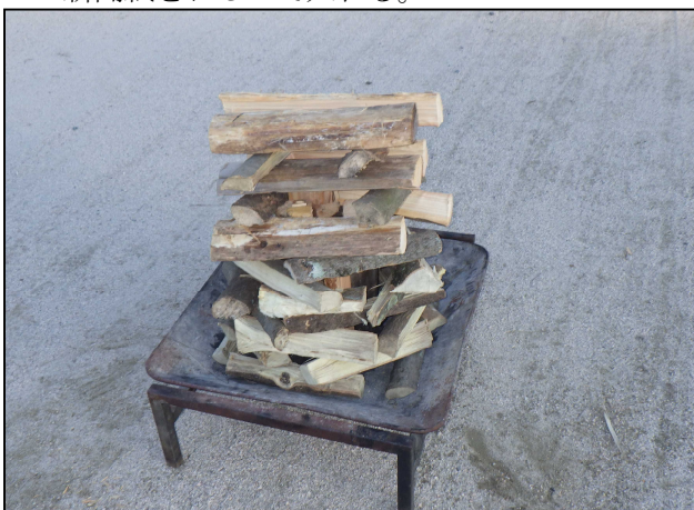
5. 8角形に組んだものの上に正方形に薪を組んでいく。