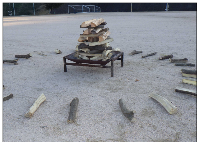
6. 残った薪は、薪台の周りに3～4m以上離して放射状に並べる。