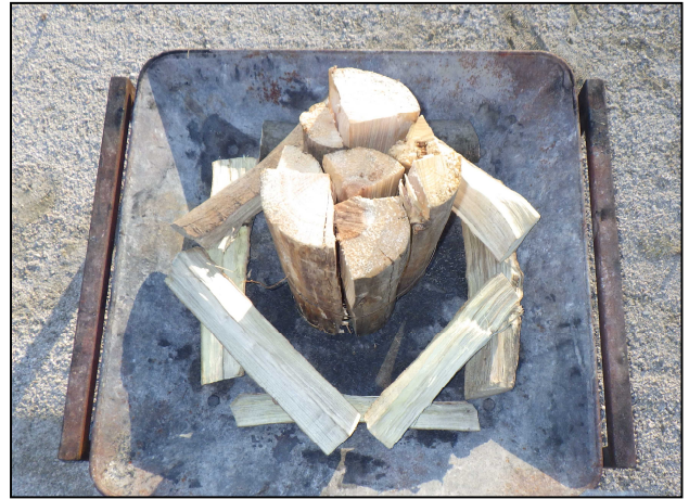
2. 周りに8角形に薪を組んでいく（太いものから）