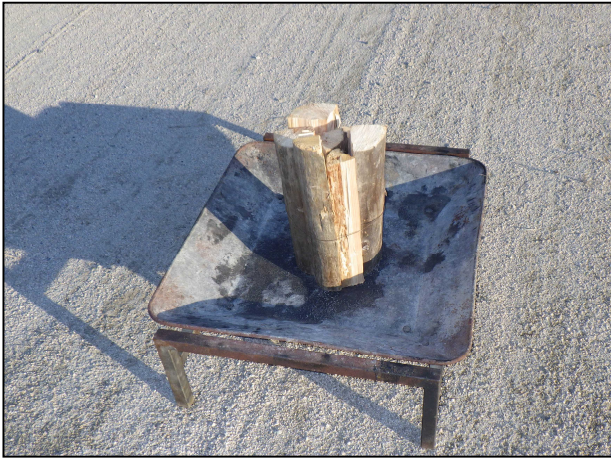
1. 火持ちをよくするために1束縦に置く