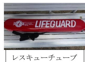
レスキューチューブ