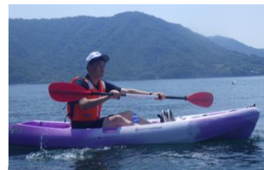
シットオンタイプ

瀬戸内海の広島湾に開けた自然豊かな水泳場（幅約100m、沖に約50m）で、カヌー研修ができる。シットオンタイプのカヌーを使い、2～3人のバディで安全を確認しながら水上を自由に移動することを楽しむことができる。