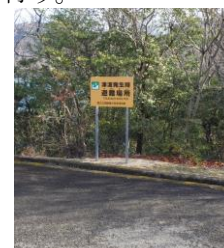
避難場所（水泳場より200m）