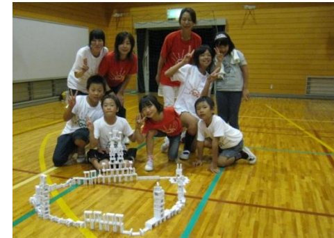
ドミノアートづくりの風景