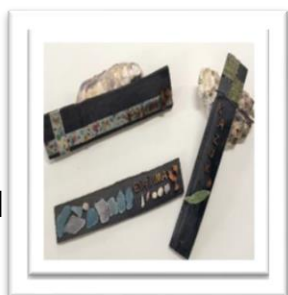
【竹炭ネームプレート】