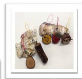
【オリーブキーホルダー】