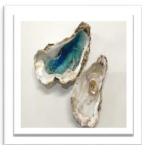
【牡蠣殻キャンドル】