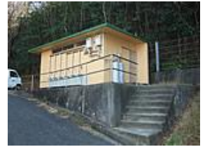
トイレ・シャワー場