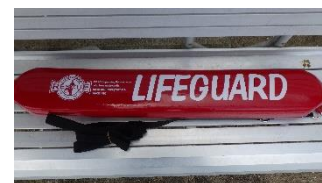
レスキューチューブ