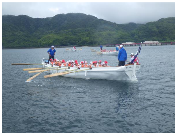
(雨天時のカッターの様子)