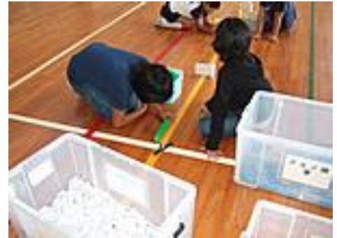
ドミノ並べの風景