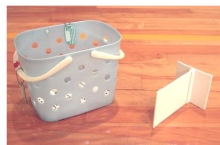
ドミノ入れカゴ と ストッパー