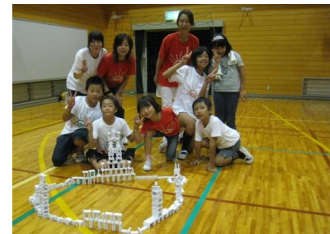
ドミノアートづくりの風景