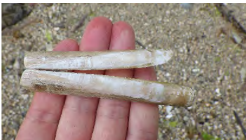
例①マテガイの貝殻