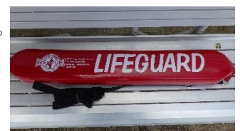
レスキューチューブ