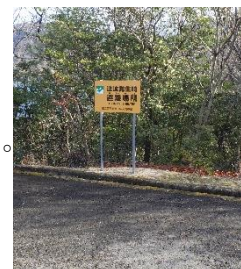
避難場所 (水泳場より 200m)