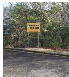
避難場所（水泳場より 200m）