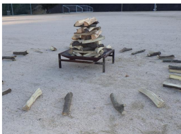
6. 残った薪は、薪台の周りに3～4m以上離して放射状に並べる。