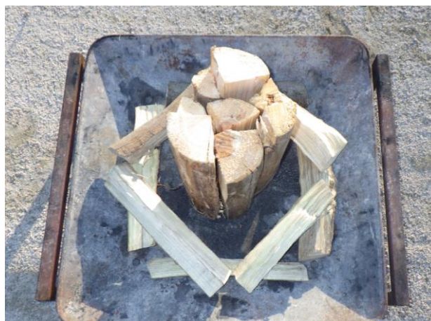
2. 周りに8角形に薪を組んでいく（太いものから）