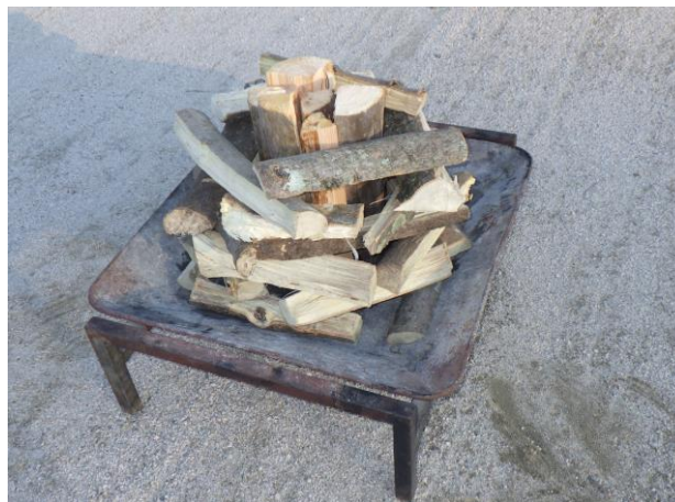
4. 細い薪を束の周りに入れていく