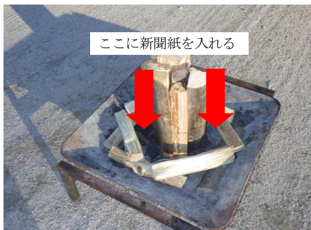
3. 束と同じくらいの高さまで組んだら束の周りに新聞紙をねじって入れる。