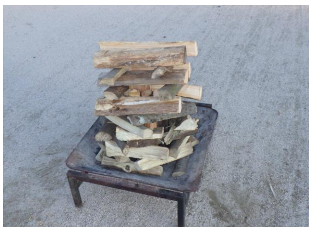
5. 8角形に組んだものの上に正方形に薪を組んでいく。