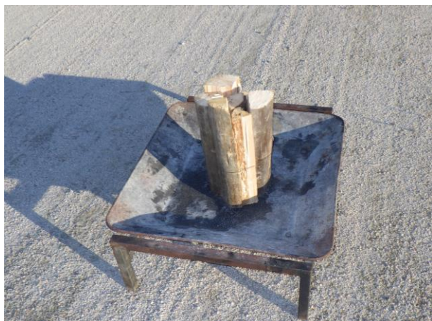
1. 火持ちをよくするために1束縦に置く