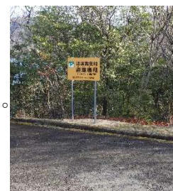
避難場所（水泳場より 200m）