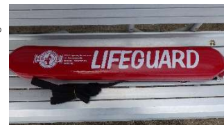
レスキューチューブ