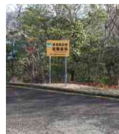
避難場所（水泳場より 200m）