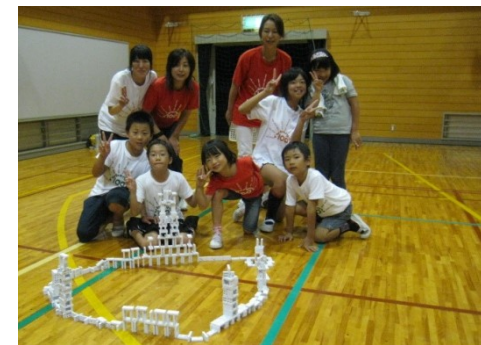
ドミノアートづくりの風景