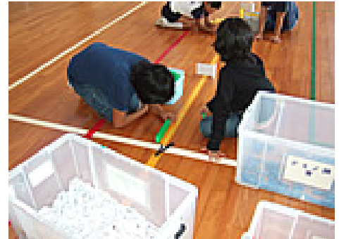
ドミノ並べの風景