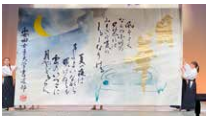
安田女子大学学生による 書道パフォーマンス