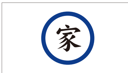
自分で書いた字を 缶バッチにしよう！