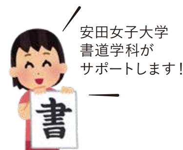
安田女子大学 書道学科が サポートします！