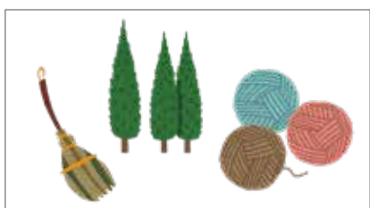
いろいろな素材の筆で 書いてみよう！