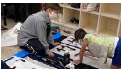
安田女子大学の学生から 書を学ぼう！