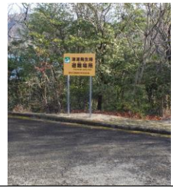
避難場所（水泳場より 200m）

事故発生の連絡が交流の家にあった場合，所長は複数の職員を現場に派遣し，救助，応急処置に加わらせるとともに，搬送用の車を手配する。緊急時には，江田島消防署，江田島警察署，第六管区海上保安本部に連絡を入れる。（①ですでに連絡済の場合，不要）