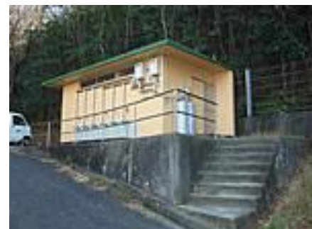
トイレ・シャワー場