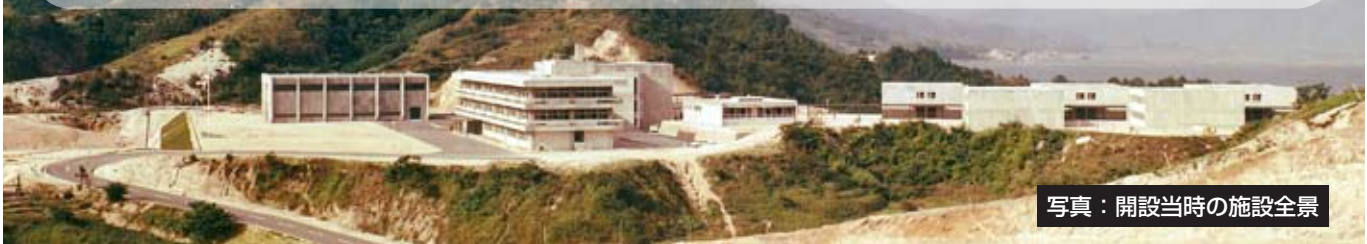
写真：開設当時の施設全景

4町合併して4年、美しい海に生き、「海生交流都市」をめざす江田島市とともに、「国立江田島青少年交流の家」のさらなる発展を願っている。