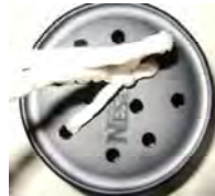
ガラスびんのふた