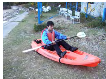
シットオンタイプ

カヌー研修を通して、海に親しむ態度や心情を育み、自然の中で活動することの楽しさを味わわせる。