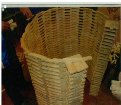
② 繰り返して積んで壁を作る。