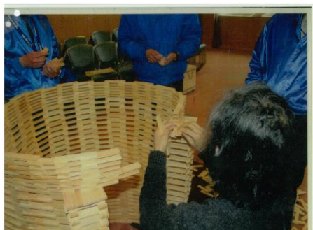
④ 開いている箇所をつなぐ。