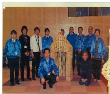
⑤ 屋根をつないで完成!