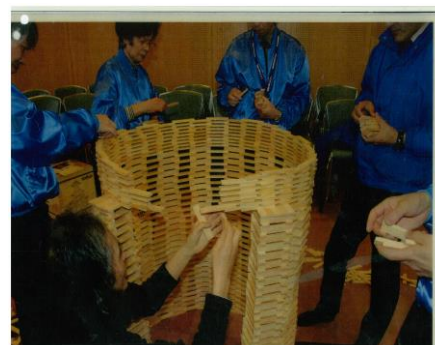
③ 狭めながら屋根を作る。