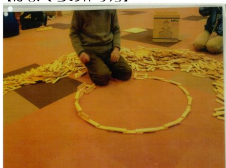
① 1段目を写真のように積んで作る。