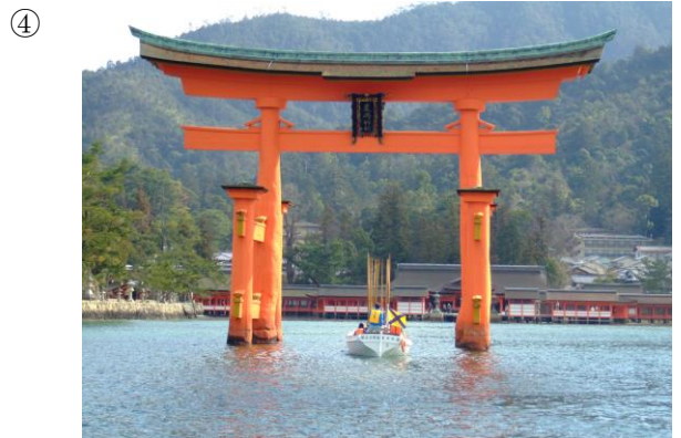
写真4 (宮島コース) *現在鳥居補修工事中