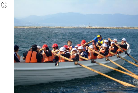
写真③ (艇庫周辺海域)