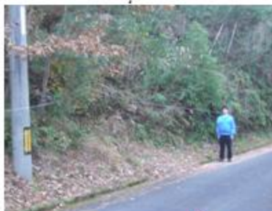
国立江田島青少年交流の家 カッター舗車