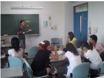
世界平和についてのグループ討論