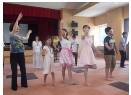
小用地区自治会の指導での盆踊りの練習