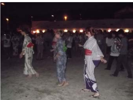
浴衣を着て盆踊り大会に参加