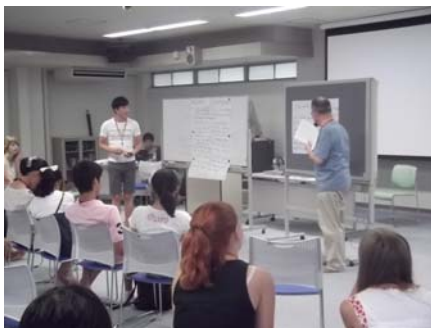
討論したことを全体討議で発表